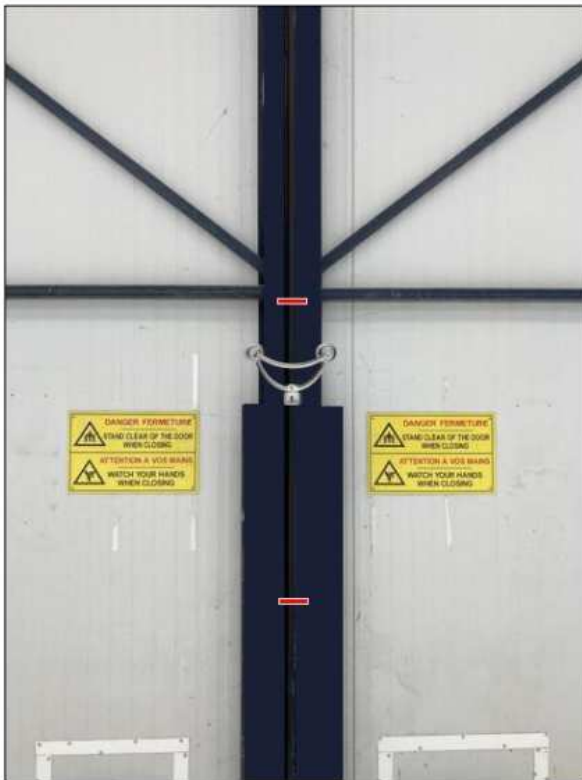
Portes des Hangars, verrouillées par un cadenas et mise en place de scellés.

Des scellés seront apposés par les agents de sûreté pour garantir l'étanchéité de la ZDZSAR.